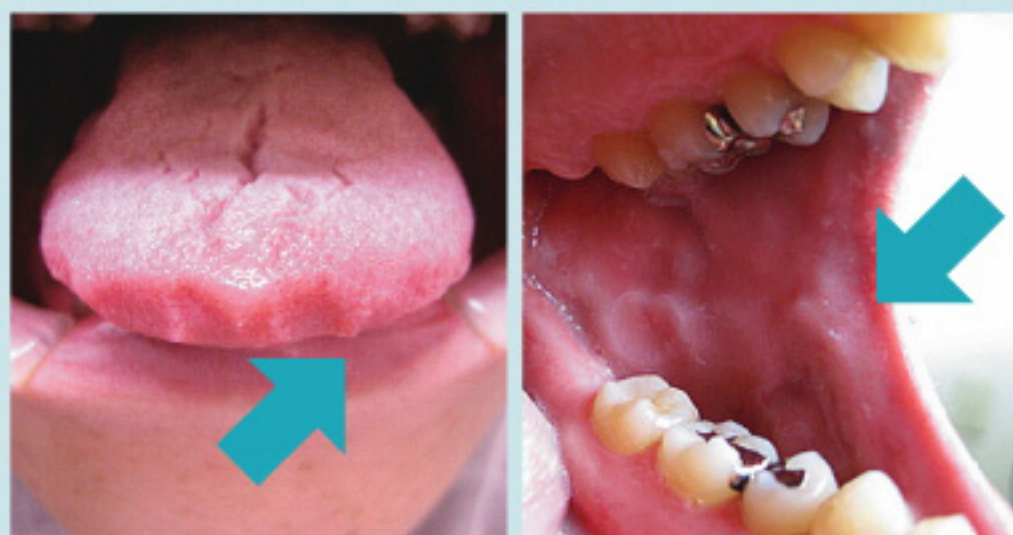
歯に過度の力が加わっていることが疑われる痕跡。頬の内側が白くなったり(右)、舌の先がギザギザになります